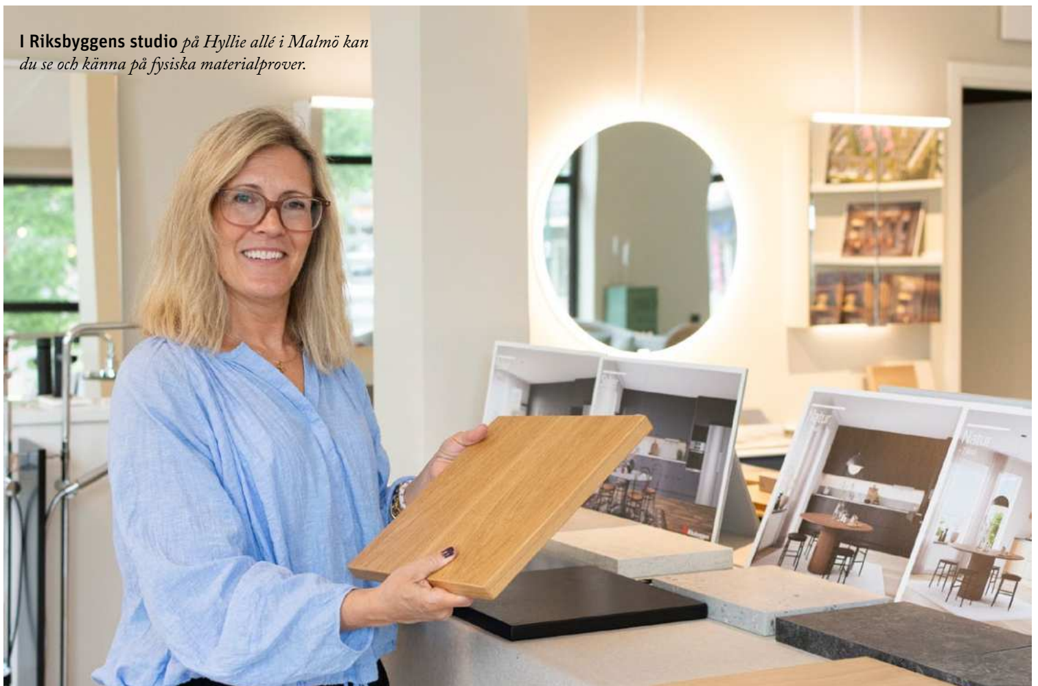
I Riksbyggens studio på Hyllie allé i Malmö kan du se och känna på fysiska materialprover.

Jag tycker att det mest fantastiska med att välja nyproduktion är att du får börja måla på en ren duk. Här har ingen annan valt kulören på dina väggar eller kaklet i köket. Du behöver inte börja med att renovera eller byta ut sliten och daterad inredning utan kan i lugn och ro innan inflyttning komponera ditt eget drömboende. När du sedan får nyckeln till huset så är det bara att börja bo och leva.