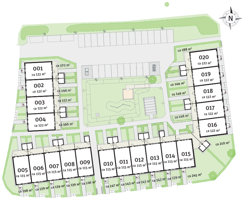
Tomtkarta med preliminära fastighetsareor